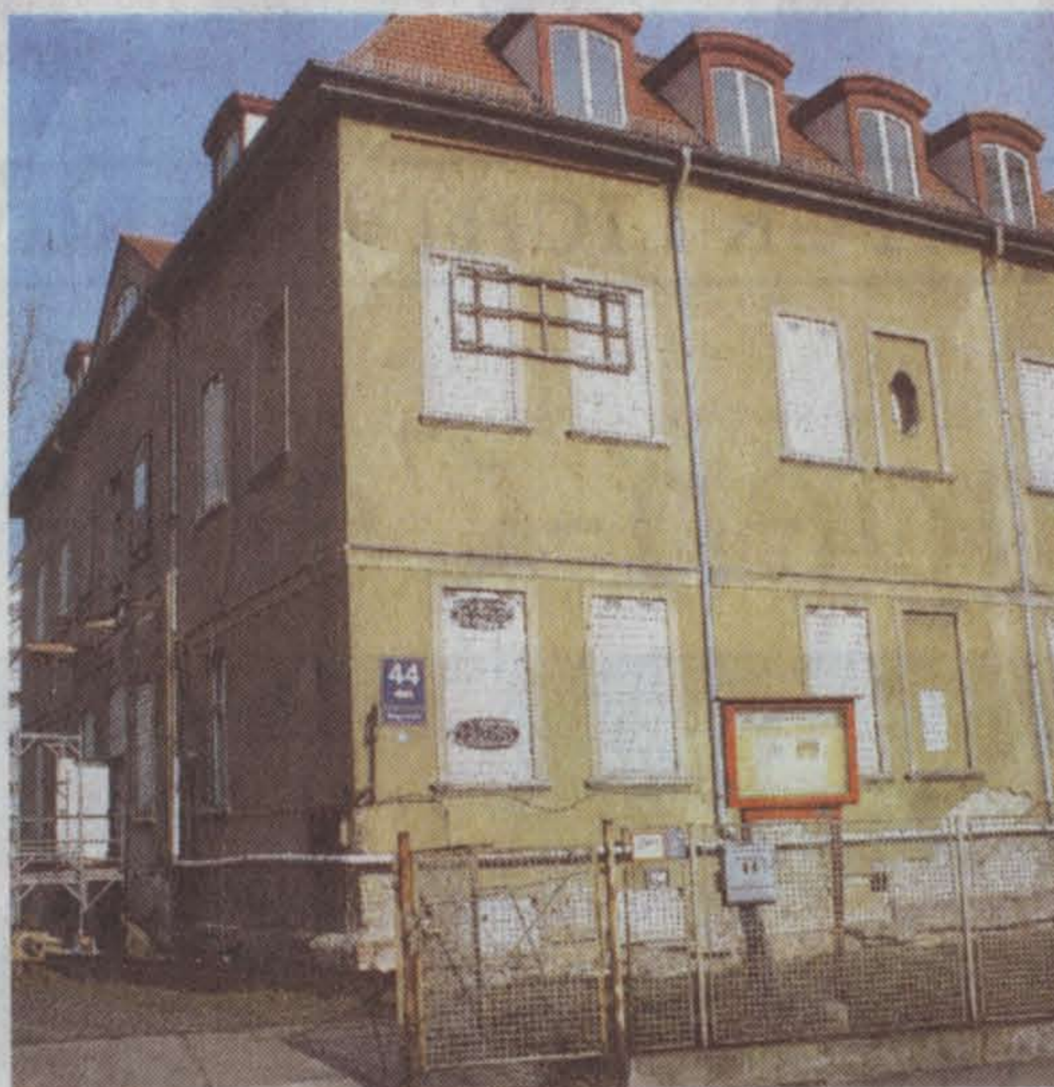
Gutshaus wird zum Bürgerschloss.

Ursprünglich hatte man angenommen, dass das Gebäude aus dem 19. Jahrhundert stamme, vor 15 Jahren fand man aber heraus, dass es sich um das Gutshaus des ehemaligen Rittergutes Hohenschönhausen handelte. Es war bereits Ende des 17. Jahrhunderts in den heutigen Umrissen errichtet worden. „Dass das Haus ein bedeutendes Bau- und Kunstdenkmal darstellt, sieht man auch daran, dass sich unter der Wand- und Deckenbearbeitung im Erd- und Obergeschoss, die im vergangenen Jahrhundert