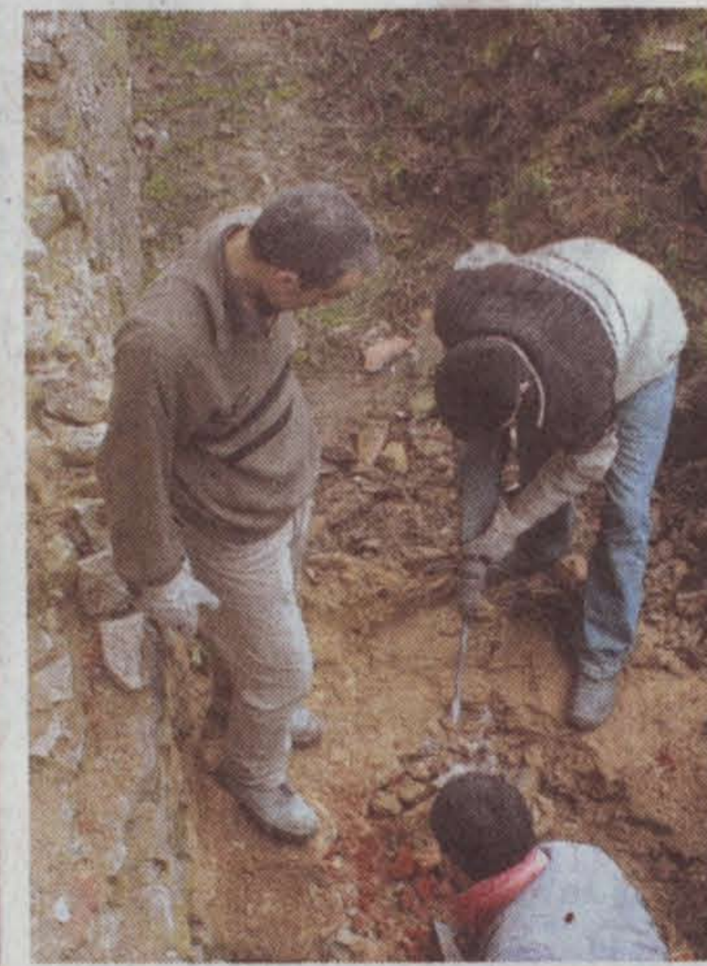
Baustelle drinnen und draußen – Eröffnung im Juli

eins unter www.schlosssh.de genannt werden.