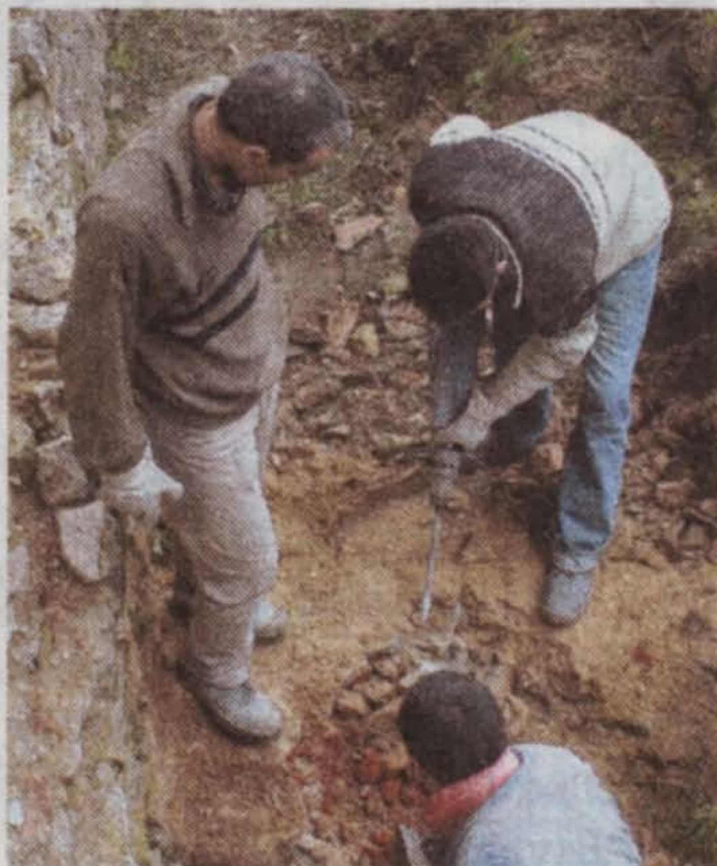
Baustelle drinnen und draußen – Eröffnung im Juli

hausen mit Museum, historischer Gedächtnisstätte und Kulturhaus eröffnet werden. Der Förderverein sucht übrigens noch Schlossbabys, also Menschen, die im ehemaligen Gutshaus geboren wurden. Über 900 Personen, die im Schloss geboren wurden, haben sich bereits gemeldet. Zur Eröffnung am 10. Juli soll das 1.000ste Schlossbaby besonders gefeiert werden. Am besten man meldet sich sofort unter Telefon 97 89 56 00 an und vereinbart einen Termin für die Sichtung von Fotos, Geburtsurkunden und anderen Dokumenten. stü